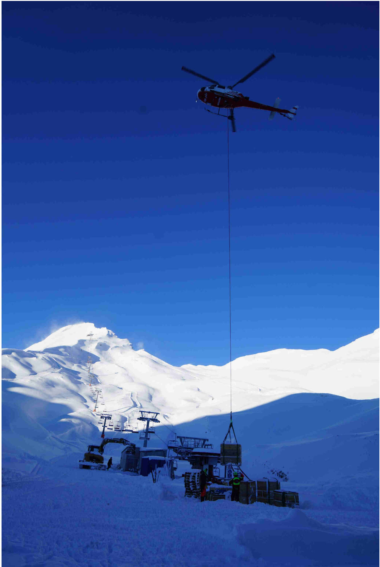
Das grosse Aufräumen der Baustellen hat begonnen. Jetzt stehen die letzten Abschluss- und Kontrollarbeiten an. Materialtransport mit Heli ab Eisee, - Platz machen für die Wintersportgäste.