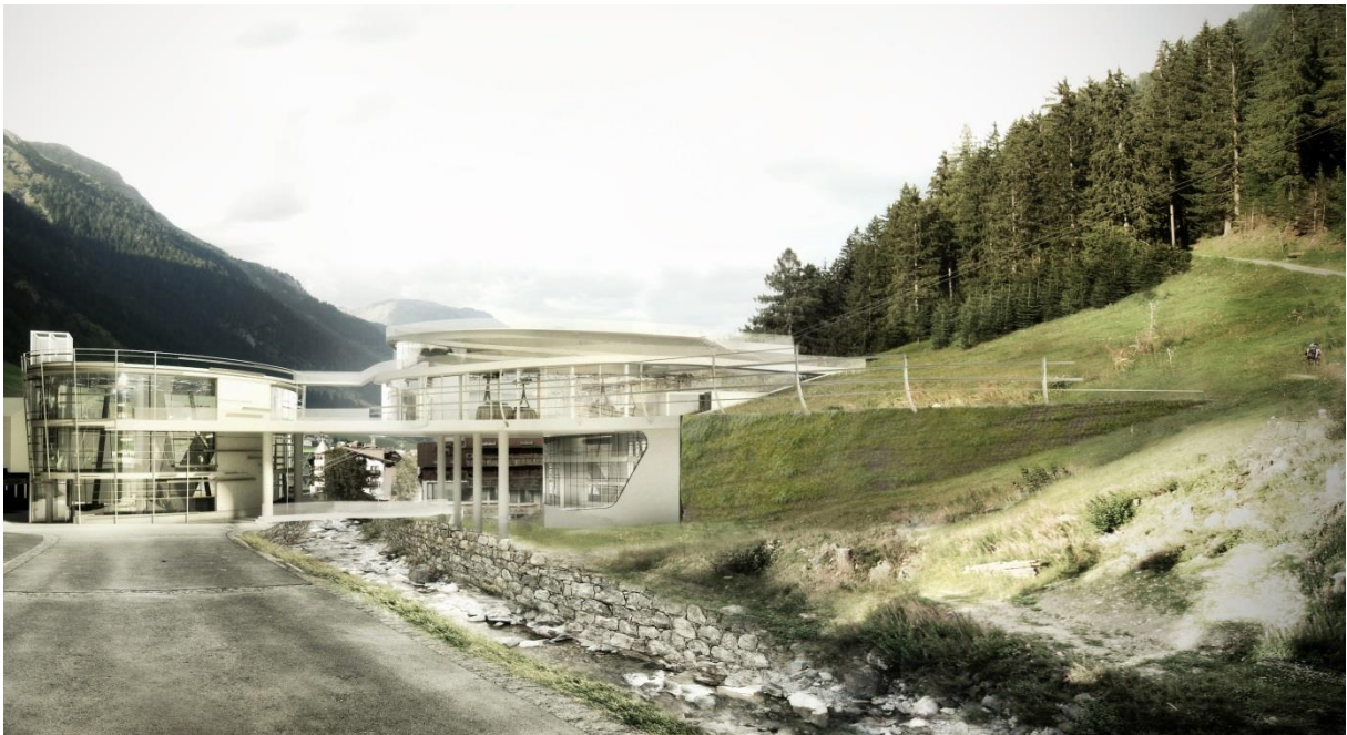
Rendering Talstation, 3-S Pardatschgrat