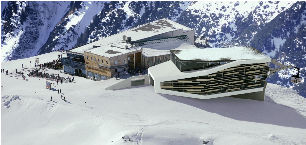
Rendering Bergstation 3-S Pardatschgrat