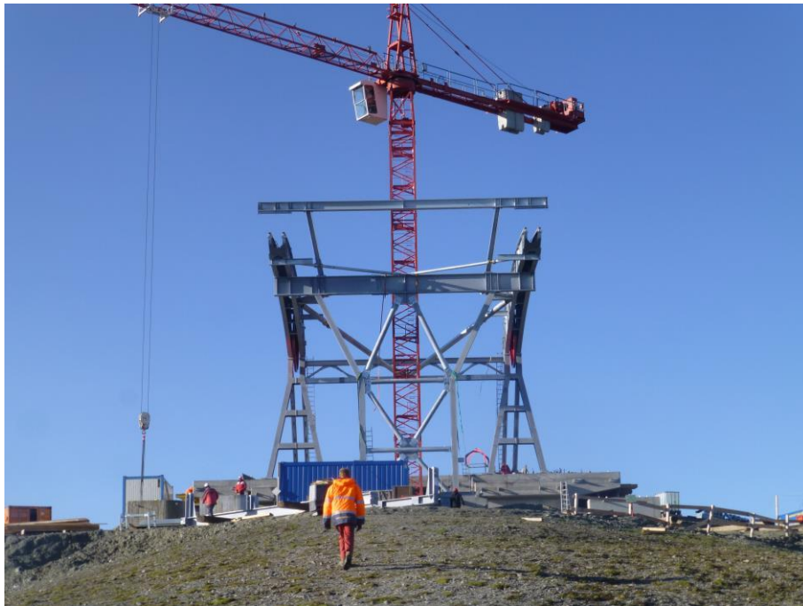
Bergstation Piz Val Gronda auf 2.812 m