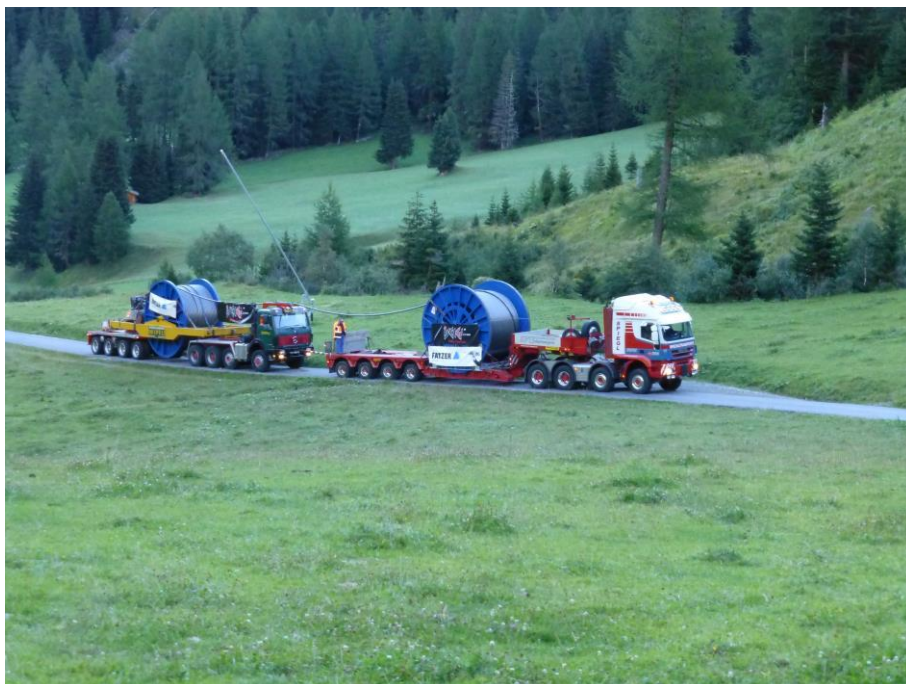
04.09.13, Anlieferung Tragseil 1 von 4 Tonnage Gespann: 160 t