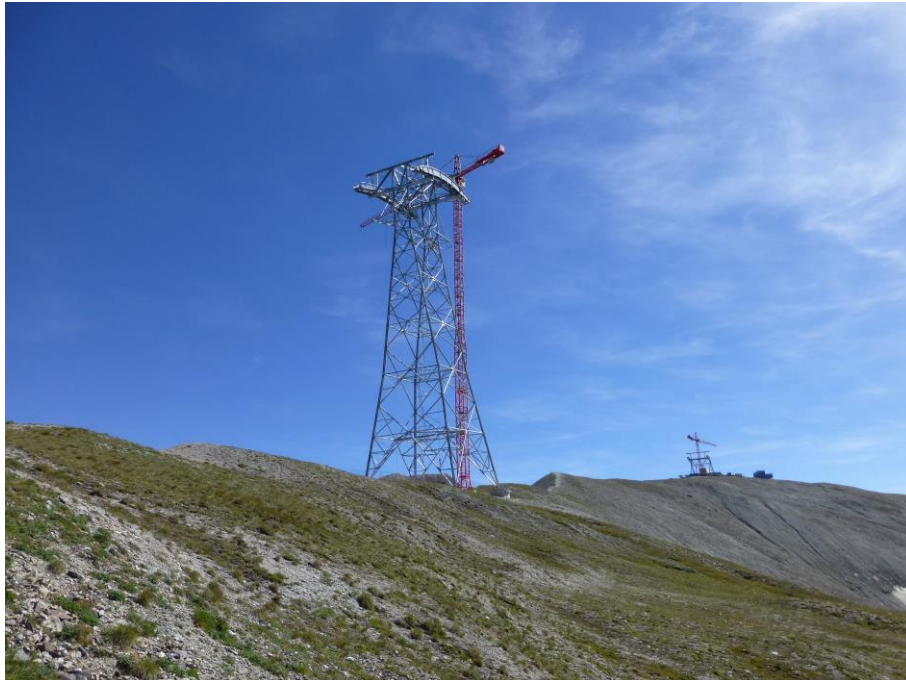
Stütze Nr. 2, im Hintergrund die Bergstation