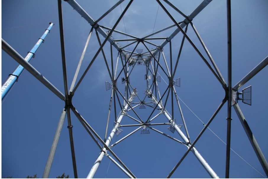
Stütze Nr. 3