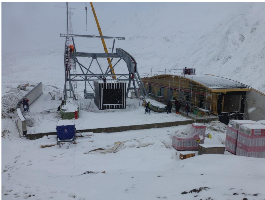
Talstation Piz Val Gronda, auf 2.295 m