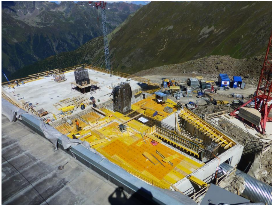
Baustelle Bergstation 3-S Pardatschgrat