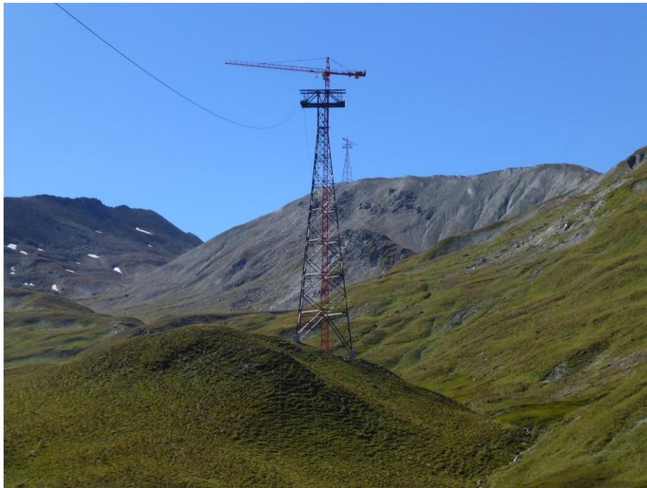
Stütze Nr. 1, Im Hintergrund die Stütze Nr. 2