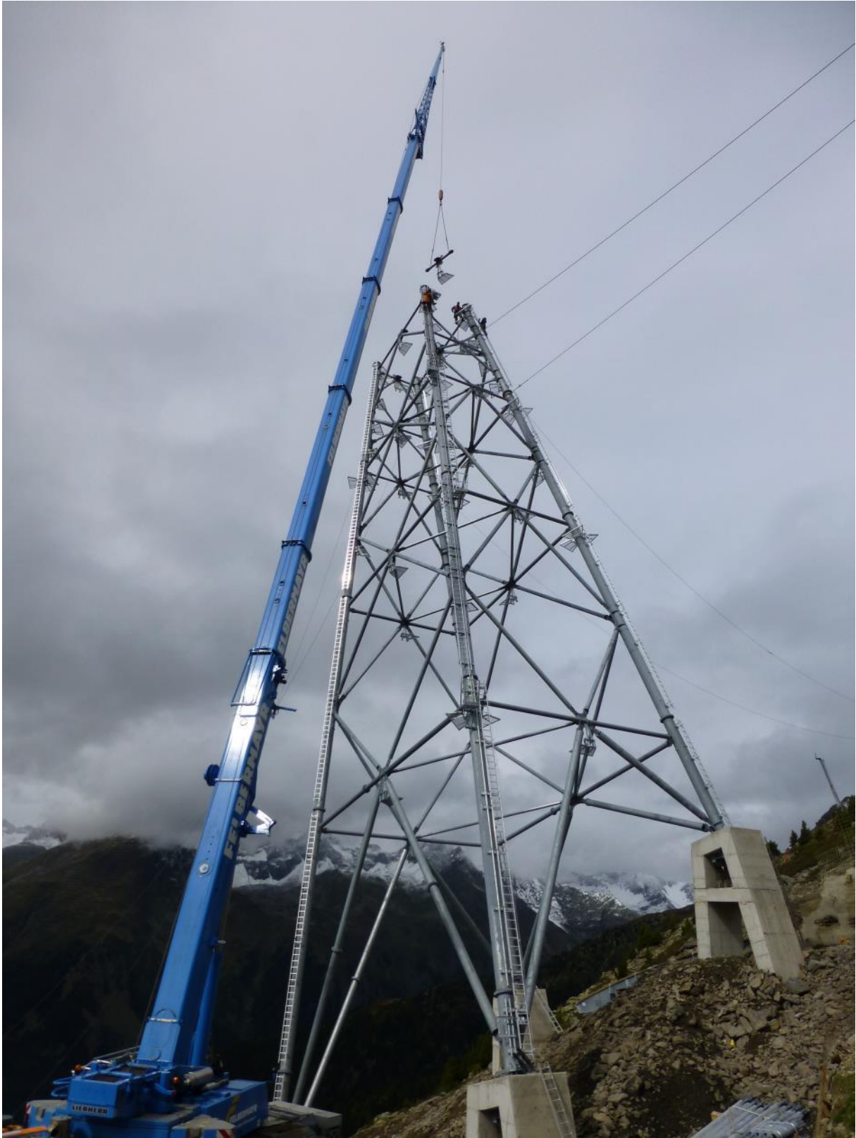
Stützenmontage Nr. 4