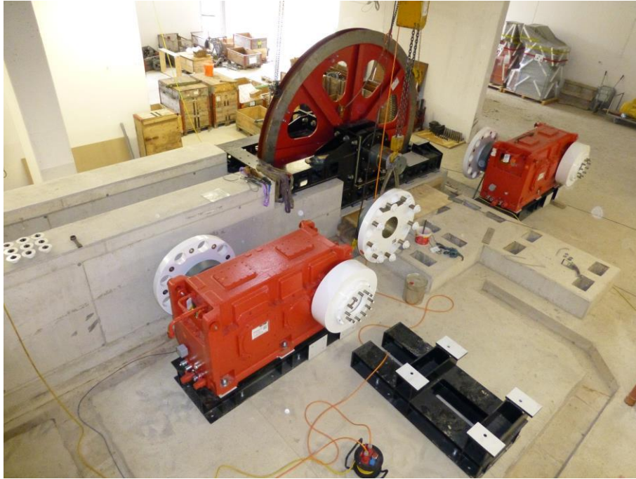
Maschinenraum Talstation mit Antriebsscheibe und Getriebe