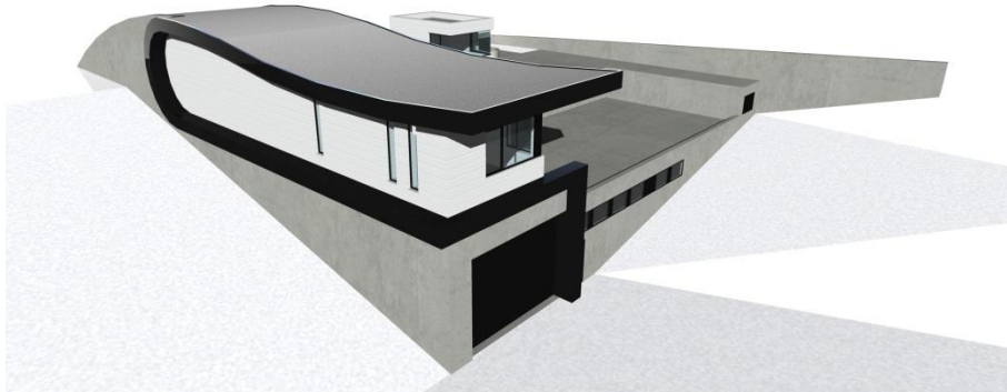
Rendering Talstation Piz Val Gronda