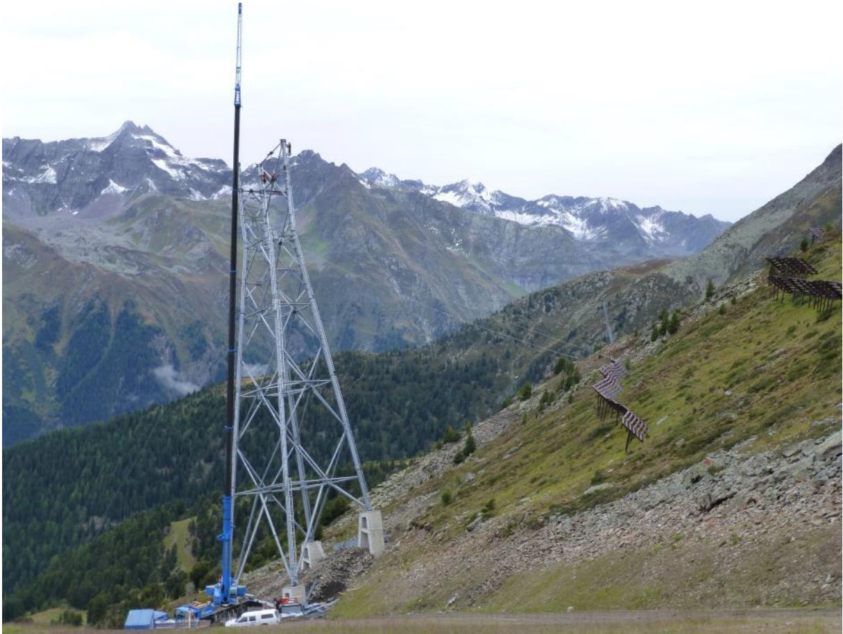
Stützenmontage Nr. 4