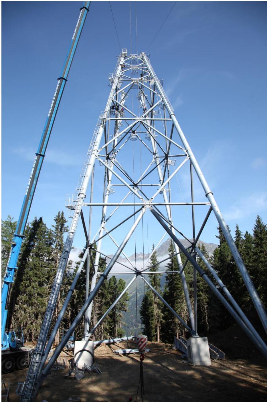
Stützenmontage Nr. 3